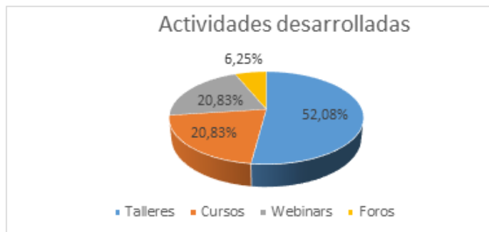
Figura 2. Actividades desarrolladas.

Como se puede observar en la tabla 2 y la figura 2, se desarrollaron un total de 48 actividades. La mayoría de las acciones estuvieron realizadas en los talleres que representan el 52,08% y posteriormente los cursos y webinars con 20,83%. Finalmente, los foros, resultaron la actividad menos desarrollada en esta etapa para un 6,25%.