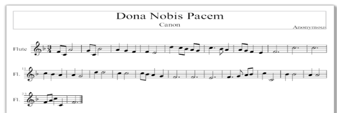
Figura 3. Canon.

Canon es una pieza (Figura 3) de carácter contrapuntístico, basada en la imitación entre dos o más voces separadas por un intervalo temporal. Una parte vocal o instrumental interpreta una melodía y unos compases más, una segunda voz repite esa misma melodía de manera exacta o bien modificando su tonalidad u otros aspectos. En este proceso pueden participar más voces. Se empieza a trabajar en el segundo ciclo, aunque también existen cánones sencillos, que podemos utilizar en el primer ciclo.