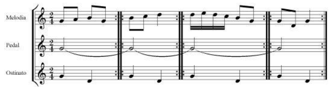
Figura 2. Ostinato melódico.

Canon es una pieza (Figura 3) de carácter contrapuntístico, basada en la imitación entre dos o más voces separadas por un intervalo temporal. Una parte vocal o instrumental interpreta una melodía y unos compases más, una segunda voz repite esa misma melodía de manera exacta o bien modificando su tonalidad u otros aspectos. En este proceso pueden participar más voces. Se empieza a trabajar en el segundo ciclo, aunque también existen cánones sencillos, que podemos utilizar en el primer ciclo.