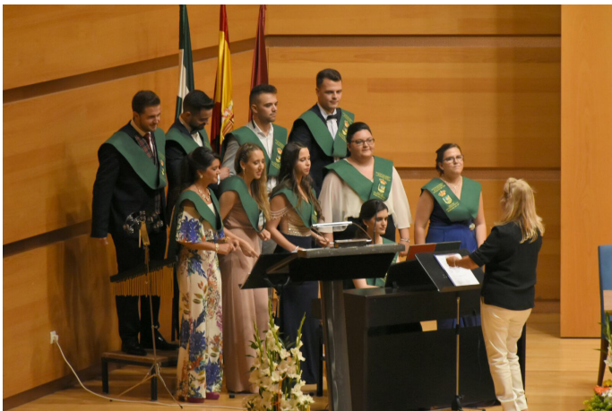
Figura 6. Coro de cámara de la Facultad de Ciencias de la Educación (Universidad de Cádiz. UCA). Acto de Graduación.