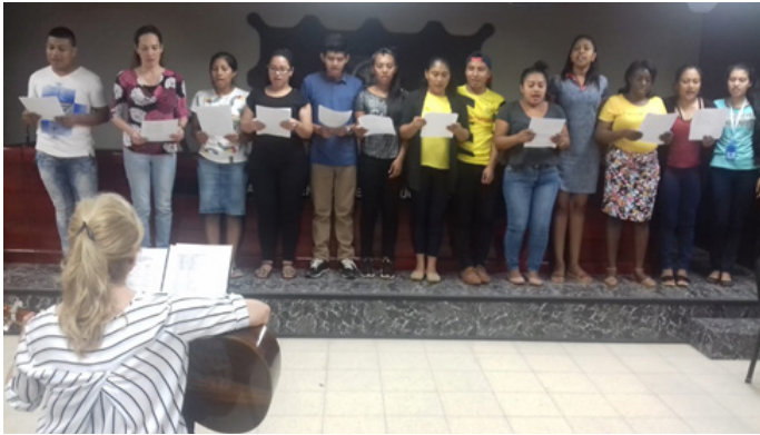
Figura 5. Ensayo con los alumnos de la Facultad de Ciencias de la Educación, Universidad de Panamá.