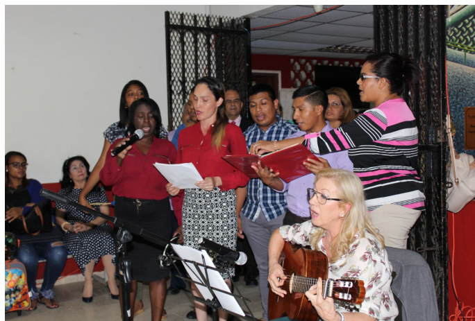
Figura 4. Prácticas con los alumnos de la Facultad de Ciencias de la Educación, Universidad de Panamá.

Este proyecto que estamos llevando a cabo en la Universidad de Panamá, seguirá el mismo esquema que el que estamos realizando para nuestra coral (Figura 4, 5 y 6) de la Facultad de Ciencias de la Educación de la Universidad de Cádiz, que es el siguiente: