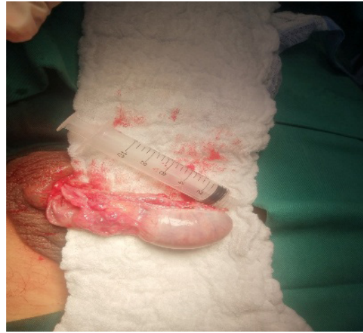
Figura 1. Abordaje hemiescrotal vertical para espermatocelatectomía derecha: incisión quirúrgica de aproximadamente 5 cm.

y favorecer una adecuada recuperación posoperatoria. El procedimiento concluyó satisfactoriamente, con hemostasia controlada y cierre por planos, garantizando condiciones óptimas para la evolución clínica del paciente.