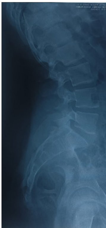
Figura 4. Radiografía de la columna de vista lateral.

Con corroboración del examen de biología molecular y las radiografías de la columna donde se logró observar el signo de “Caña de Bambú” característico de Espondilitis Anquilosante (Figura 3 y 4).