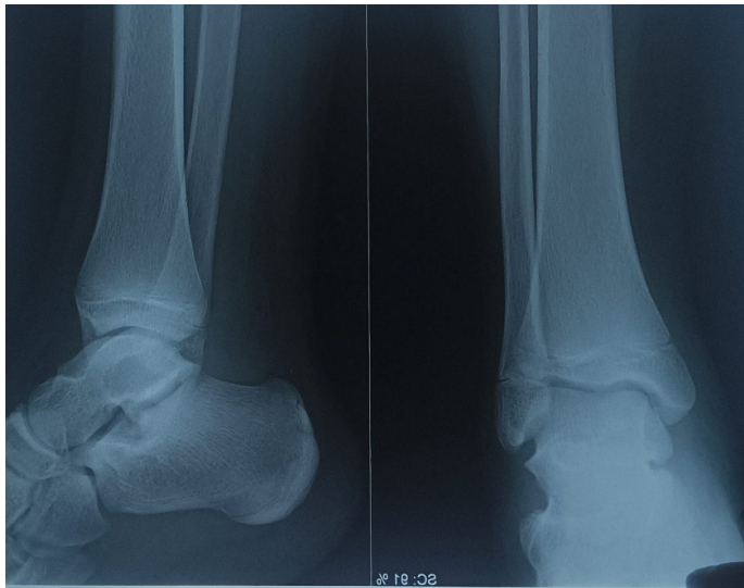
Figura 1. Radiografía de la articulación del tobillo izquierdo.