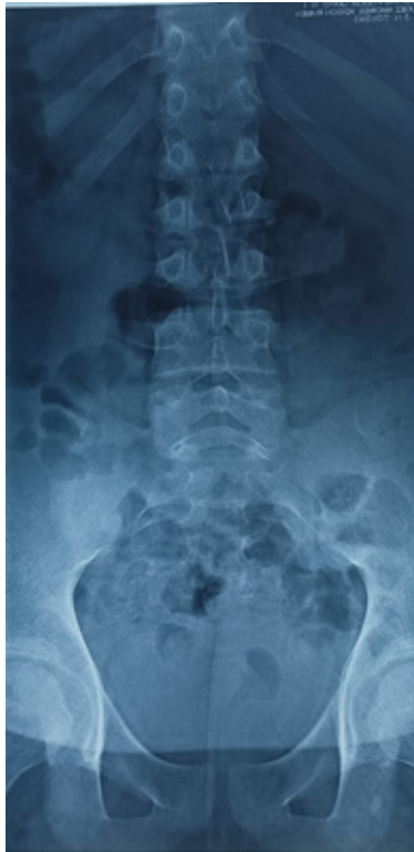
Figura 3. Radiografía de la columna de vista frontal.